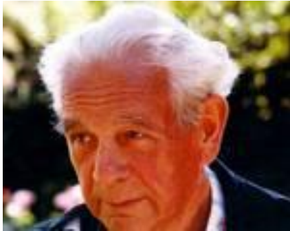
Figura 1 - Gösta Gustafson 1 .

Gösta Gustafson (1906-2001†) se graduou em Odontologia em 1932 pela Universidade de Munique e, em 1934, em Estocolmo. Sua atuação era especialmente em histopatologia dos tecidos duros dentais com foco na estimativa da idade, com a primeira publicação na década de 1940 e com vários trabalhos publicados até o final da década de 70 2-13 .